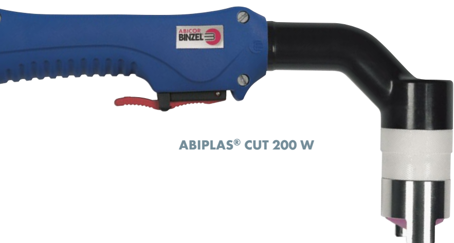
ABIPLAS® CUT 200 W

Nejvyšší možná efektivita, nejlepší řezací výkon a větší flexibilita pro nejlepší možné výsledky v každodenním pracovním nasazení.