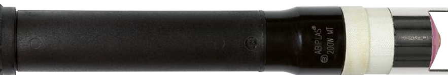
ABIPLAS® CUT 200 W MT